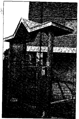
La sede della Molise Dati

zione dei tralicci su cui vengono montati gli apparati e sarà completato entro la fine dell'anno (salvo altri problemi urbanistici sollevati dagli enti competenti). Il Consigliere in parola dovrebbe avere una certa dimestichezza familiare con gli aspetti urbanistici!